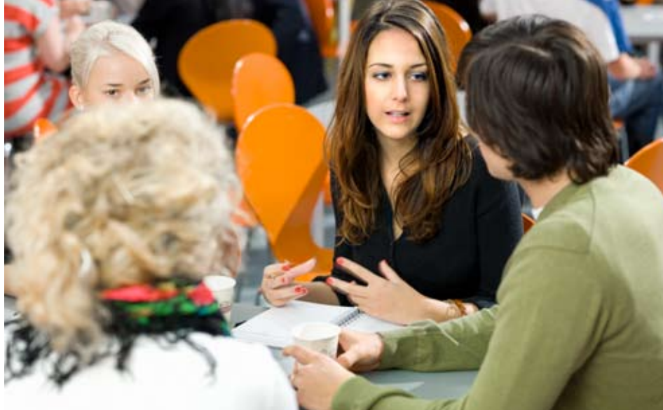
Arbetsätt. Individuella studiemål och personlig handledning är viktigt för Kunskaps gymnasiet s elever.