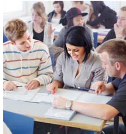
Studiemål. För att nå ett bra resultat har Glajol koll på kursmål och kriterier innan sin lektion.