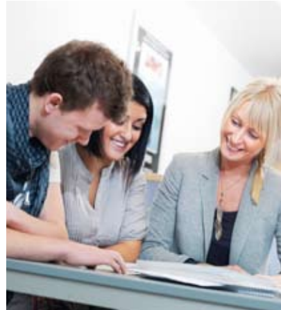
Inplanerade studiepass. Glajol har planerat in flera workshops där hennes lärare finns tillgängliga.